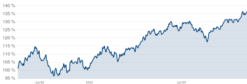
Frankfurter Modern Value Index